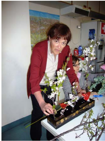
Eine Teilnehmerin hatte sich für den „One-Row-Style“ entschieden und diesen mit den wunderschönen „Sakura-Blüten“ in Szene gesetzt.